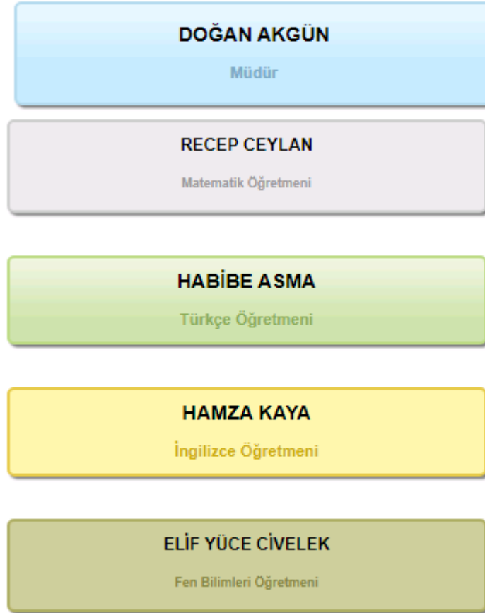
Şekil 1: Organizasyon Şeması